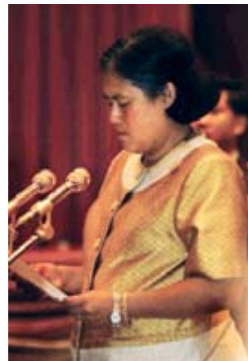
La Princesa Maha Chakri Sirindhorn

de la movilización de recursos y la creación de ámbitos legislativos y normativos propicios a las cuestiones de población y desarrollo. La Sra. Çagar señaló que los participantes en la Conferencia pasarían revista a los progresos logrados hasta la fecha y adoptarían resoluciones sobre una estrategia para la acción futura. Agradeció a los parlamentarios su liderazgo y sus acciones de promoción, que habían generado mayor apoyo al programa de la CIPD y también habían dinamizado las acciones de sus colegas en organismos legislativos y ejecutivos. Agregó que el acontecimiento más importante ocurrido después de la Conferencia de Estrasburgo de 2004 fue que en la Cumbre Mundial de las Naciones Unidas, 2005, los líderes mundiales se comprometieron en pro de dos importantes objetivos de la CIPD: acceso universal a servicios de salud reproductiva para 2015; y autonomía de la mujer y equidad e igualdad entre los géneros. La Sra. Çagar señaló que, si bien en 2005 los países tanto en desarrollo como desarrollados alcanzaron las metas de recursos acordadas en la CIPD, El Cairo, 1994, después de 1994 cambió radicalmente la situación en el ámbito del desarrollo. Se calcularon nuevas estimaciones actualizadas del costo real de alcanzar los objetivos de la CIPD, llegando a importes de recursos muy superiores a los previstos en 1994. La