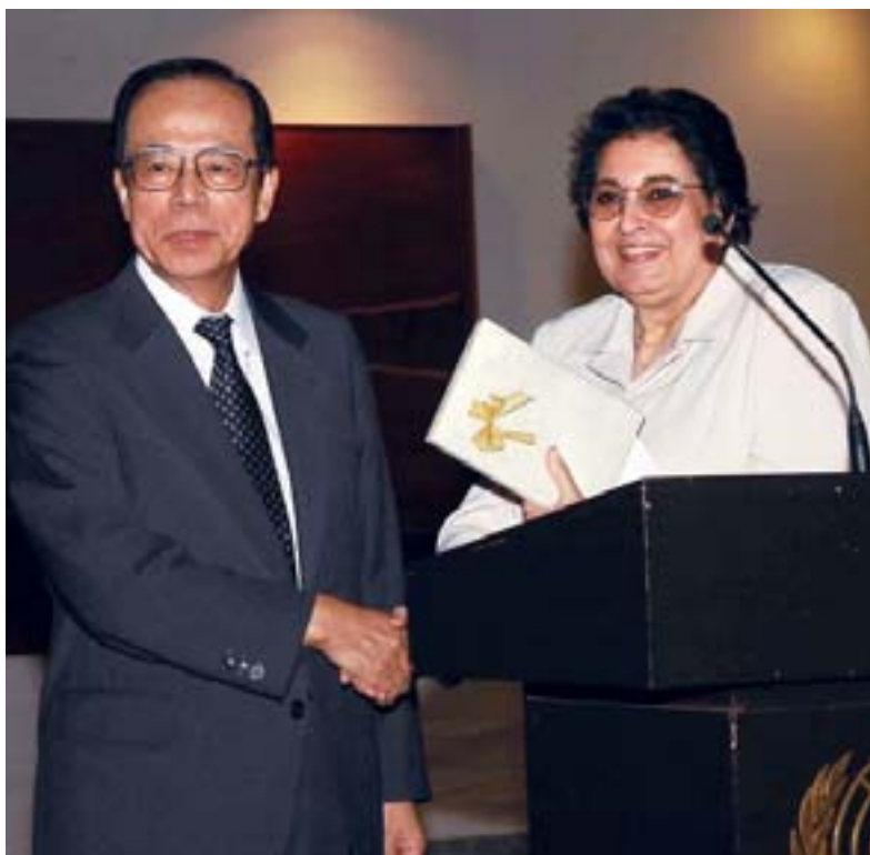
La Directora Ejecutiva del UNFPA, Sra. Obaid, recibe un testimonio de agradecimiento, que le entrega el Presidente de la AFPPD, Sr. Fukuda

conferencias anteriores se celebraron, respectivamente, en Ottawa, Canadá, en 2002; y en Estrasburgo, Francia, en 2004. El propósito de la serie de conferencias IPCI/CIPD es centrar la atención en dos elementos esenciales necesarios para la ejecución exitosa del Programa de Acción de la memorable Conferencia Internacional sobre la Población y el Desarrollo (CIPD) celebrada en 1994: a) crear ámbitos legislativos y normativos propicios para promover los temas de: población y desarrollo; salud