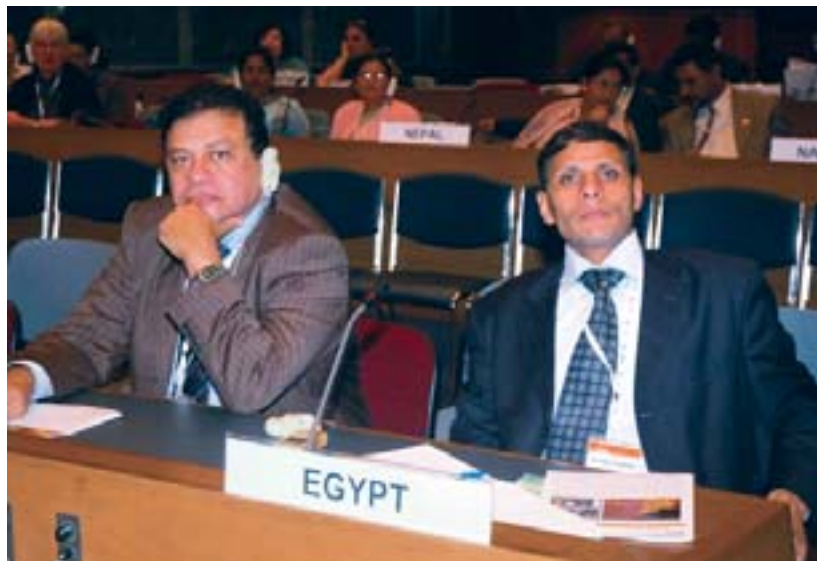
Parlamentarios de Egipto escuchan a los oradores en el plenario