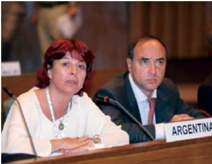
Una parlamentaria de la Argentina habla durante el plenario

y otros grupos vulnerables. También hay sustanciales discrepancias en materia de desarrollo, entre distintos países de la región y dentro de un mismo país;