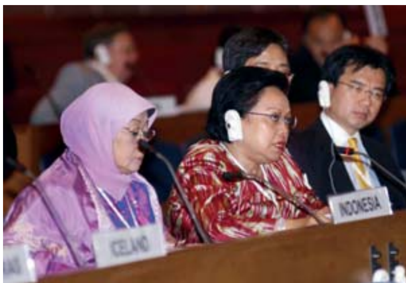
Una parlamentaria de Indonesia habla durante el plenario