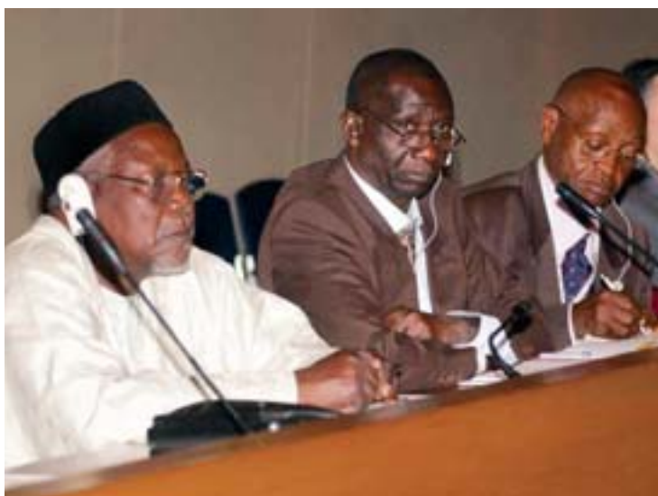
Parlamentarios de África intercambian ideas con el grupo