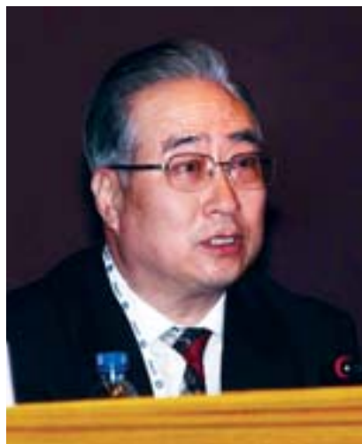
El Sr. Weiqing

El Excmo. Sr. Zhang Weiqing recordó que China es el país más populoso del mundo, destacó aspectos clave de cuestiones de población y desarrollo. Tras señalar los efectos de importancia crítica que tienen las cuestiones de población sobre el desarrollo socioeconómico, el orador subrayó los importantes vínculos entre: dinámica de la población, recursos,