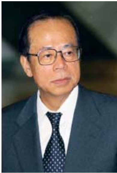
El Sr. Fukuda

exhorta a todos a “ser buenos, ser rectos, ser justos” y señaló que esto es imprescindible para lograr un desarrollo sostenible y mejorar las vidas y el bienestar de todas las personas del mundo.