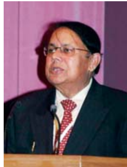
El Sr. Khare

estatales y locales para llegar al público en amplia escala, inclusive a nivel de las comunidades de base; y c) dado el aumento de la población de jóvenes en todo el mundo, la necesidad de ampliar la participación y el compromiso de los parlamentarios en cuestiones relativas a la juventud, inclusive la salud reproductiva de los adolescentes. El Sr. Khare agregó que también va en aumento el número de jóvenes elegidos como parlamentarios y que sería importante involucrarlos en los temas relativos a la juventud y la promoción del programa de la CIPD.