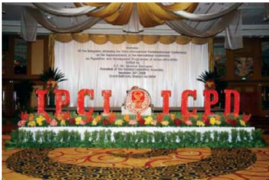
Telón de fondo en la zona de recepción de la ICPI/CIPD