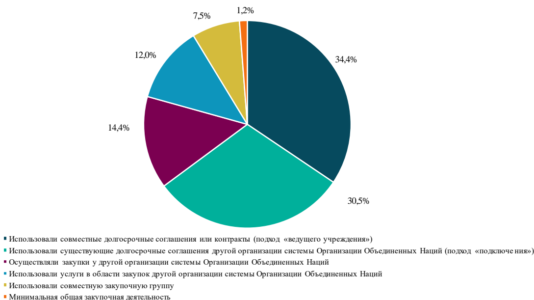
Рисунок 2 Инициативы в области совместных закупок в разбивке по типам, 2018 год

9. На рисунке 2, приведенном ниже, представлена информация об объемах инициатив и мероприятий, осуществленных ПРООН, ЮНФПА и ЮНОПС, по шести типам совместной закупочной деятельности. Инициативы используют как совместные долгосрочные соглашения или контракты (подход «ведущего учреждения»), так и существующие долгосрочные соглашения другой организации системы Организации Объединенных Наций (подход «подключения»), и на их долю приходилось почти 65 процентов совместных закупок, осуществленных в 2018 году тремя организациями.