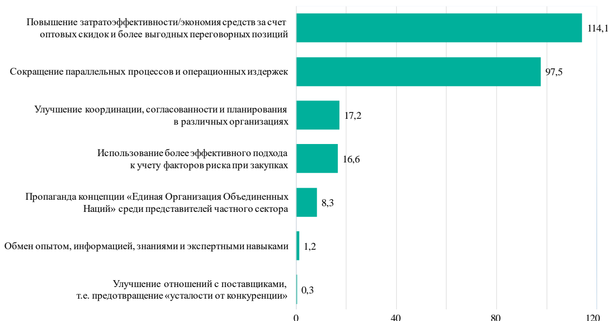
Рисунок 3 Преимущества, достигнутые в 2018 году, в количественном выражении и в разбивке по типам (В млн долл. США)