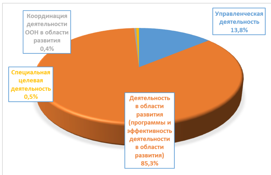
Диаграмма 2. Распределение имеющихся ресурсов в период 2018–2021 годов — пересмотренное

19. ЮНФПА продолжает направлять основную часть своих ресурсов на деятельность в области развития. Согласно прогнозным значениям, приведенным в среднесрочном обзоре на 2018–2021 годы, на деятельность в области развития ЮНФПА выделит 85,3 процента от общего объема имеющихся ресурсов, что превышает показатель 84,9 процента, который был запланирован в пересмотренном бюджете на 2018–2021 годы.