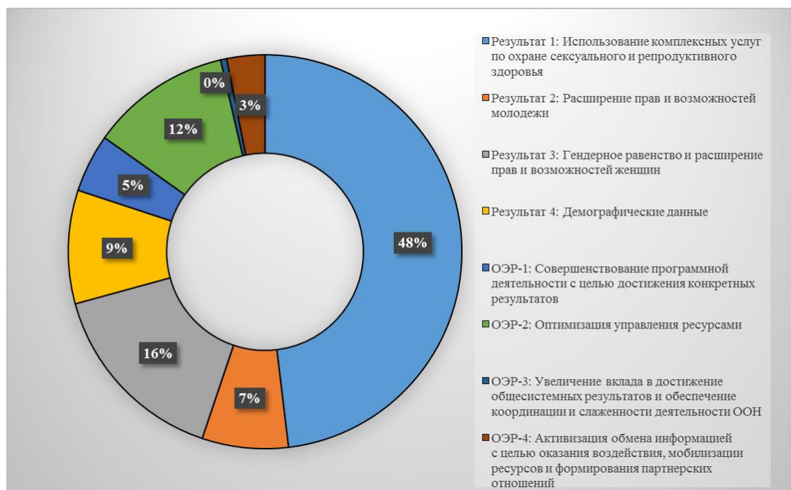
Диаграмма 3. Ориентировочные ассигнования в разбивке по результатам и задачам в период 2018–2021 годов — пересмотренные

50. На диаграмме 3, приведенной ниже, отражено твердое намерение Фонда направлять преобладающую часть общего объема своих ресурсов на достижение результатов в области развития (80 процентов от общего объема). Приблизительно 48 процентов от общего объема ресурсов направляется на достижение результата 1, что отражает неизменную приверженность концепции «прямого попадания», то есть стратегической направленности, которая была вновь подтверждена в Стратегическом плане ЮНФПА на 2018–2021 годы.