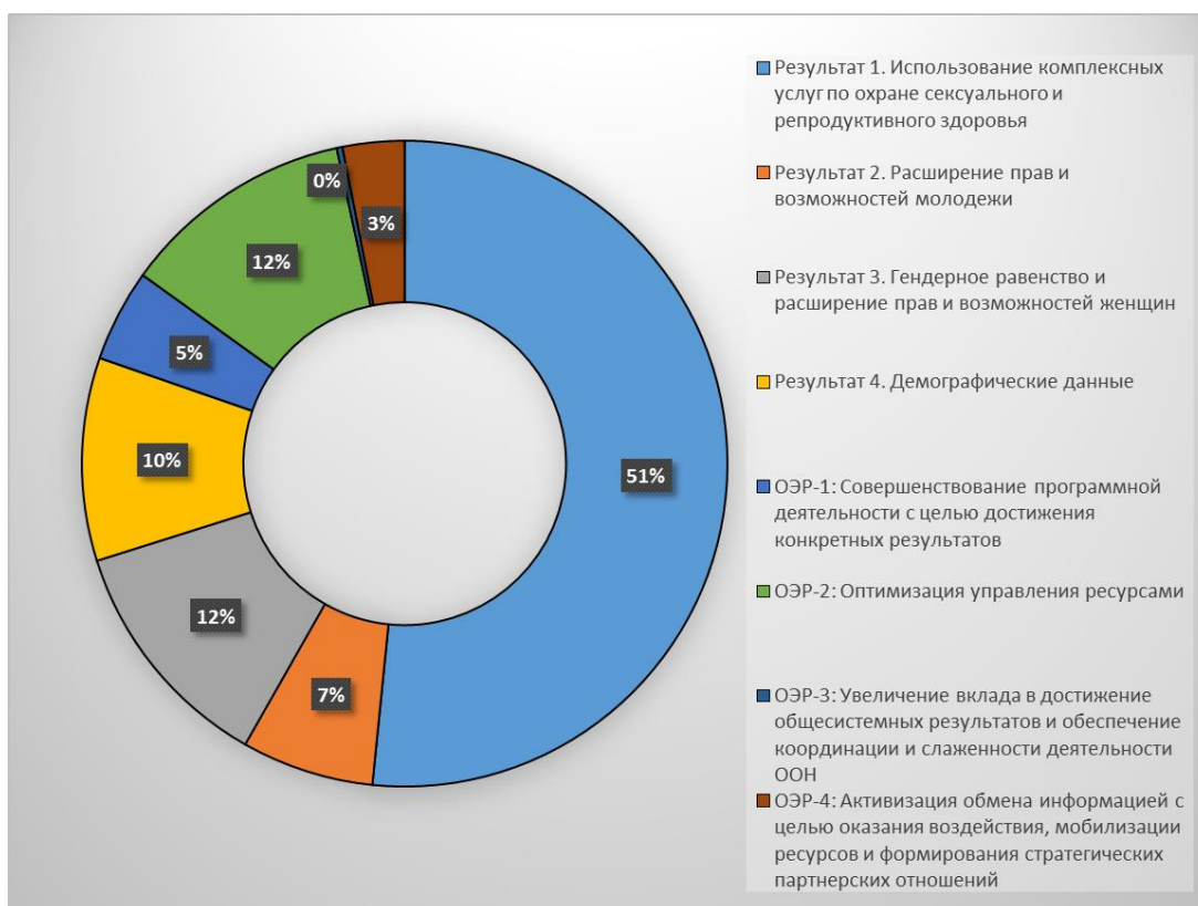
Диаграмма 3. Ориентировочные ассигнования в разбивке по результатам и задачам в период 2018–2021 годов — пересмотренные

49. Ориентировочное выделение ресурсов для достижения четырех результатов в области развития и решения задач повышения организационной эффективности и результативности увязано с приоритетами Стратегического плана на 2018–2021 годы и отражает результаты, которые ЮНФПА стремится достичь в период 2018–2021 годов. Подробная информация приведена в стратегическом плане, описании теории изменений и сопутствующих целевых показателей, предусмотренных в сводной таблице результатов и ресурсов, однако некоторые элементы необходимо выдвинуть на первый план.