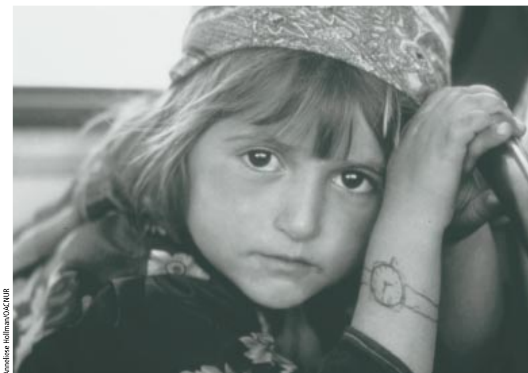
Una niña educada puede tener opciones. En la foto, niña repatriada en Tayikistán, 1995.

A partir de 1982, el FNUAP ha brindado apoyo a más de 20 proyectos en que se combinaron la prestación de los servicios y la información sobre salud de la reproducción con actividades de microcréditos, en países tan disímiles como la India, Madagascar, el Paraguay y el Sudán. Esas experiencias confirman que los beneficios del control individual sobre la propia vida económica y de reproducción se refuerzan recíprocamente. Al mejorar los medios de vida y asegurar al mismo tiempo el acceso a los servicios y la información sobre salud de la reproducción, se elevan la autoestima de la mujer, su confianza, su participación en la vida política y de la comunidad y sus facultades de adoptar decisiones, así como su posición en la familia. Las mujeres se benefician, sus familias se benefician y sus comunidades prosperan.